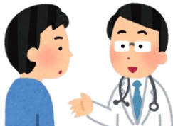
経営の早めの健康相談

経営の 早め の健康相談と考え、気をつける点を知り、改善したい習慣等の見直しに役立てます。